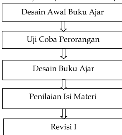
Gambar 1. uji coba produk buku hasil pengembangan.

Kegiatan uji coba produk buku hasil pengembangan dilakukan sebagai langkah evaluasi formatif yang terdiri atas penilaian isi materi serta penilaian rancangan pembelajaran dalam hal ini adalah manajemen sekolah, uji coba perorangan 3 siswa, uji coba kelompok kecil 15 siswa, dan uji coba kelompok besar 30 siswa. Secara sistematis tahapan uji coba produk buku hasil pengembangan dapat dilihat pada gambar diagram sebagai berikut: